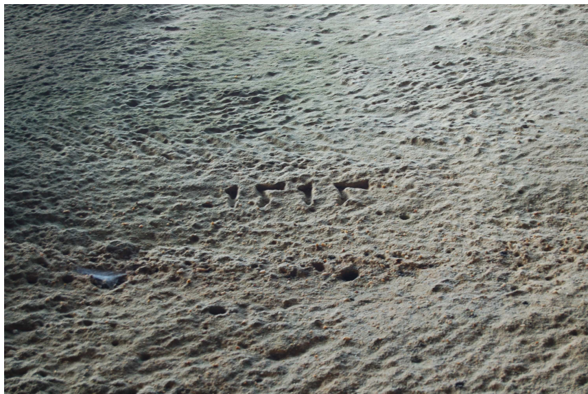
Datace 1515 na lomové stěně zvané „Skalní chodba“.